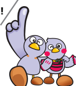
埼玉県マスコット